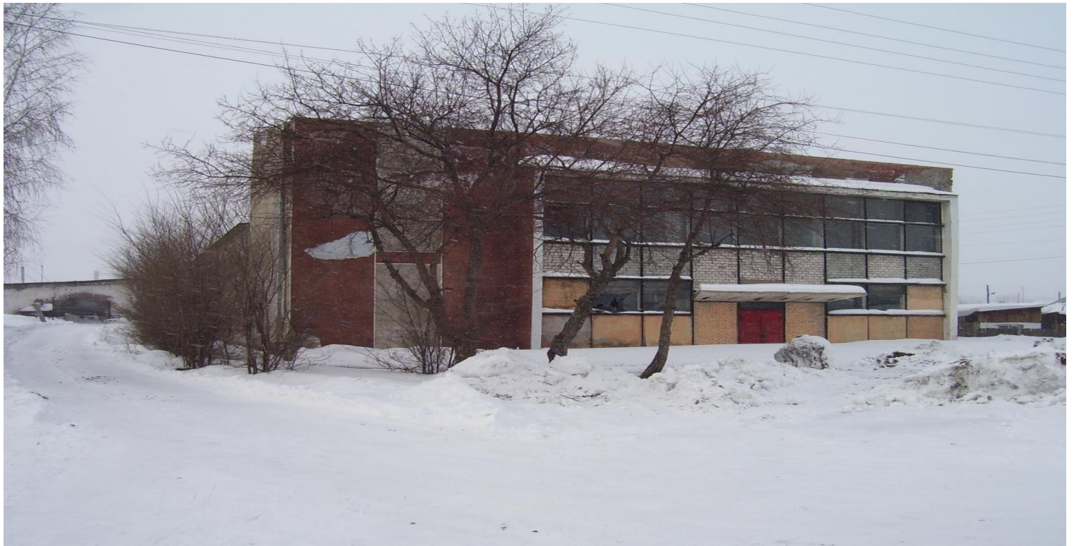
Клуб ТЗТА. Современный вид