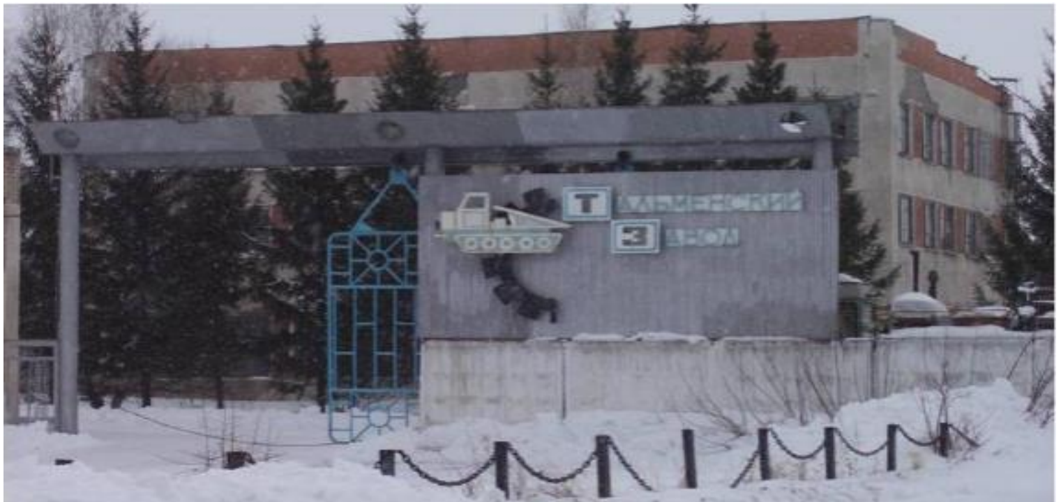
Современный вид завода

В конце 80-х – начале 90-х гг. спрос на продукцию ТЗТА стал падать. Коллектив стал распадаться.