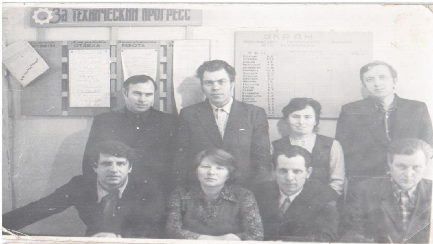
Технический отдел завода тракторных агрегатов 1979 год

В декабре 1980 года была выпущена первая партия деталей из металлического порошка. Часть выпускаемой продукции шла на Челябинский тракторный завод. Введение в действие прессы ДА-1534 дало большую экономию металла и увеличение номенклатуры изделий.