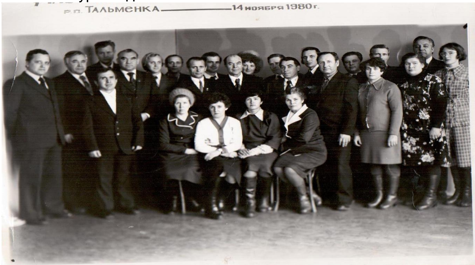
Коллектив администрации завода 1980 год