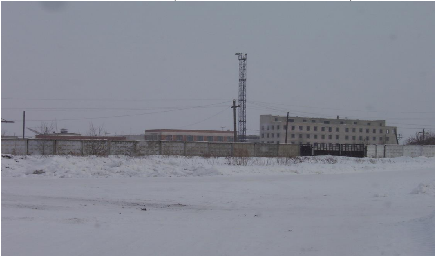
Общий вид современного завода

Остатки производственных помещений выставлены собственником на продажу. Здания постепенно разрушаются.