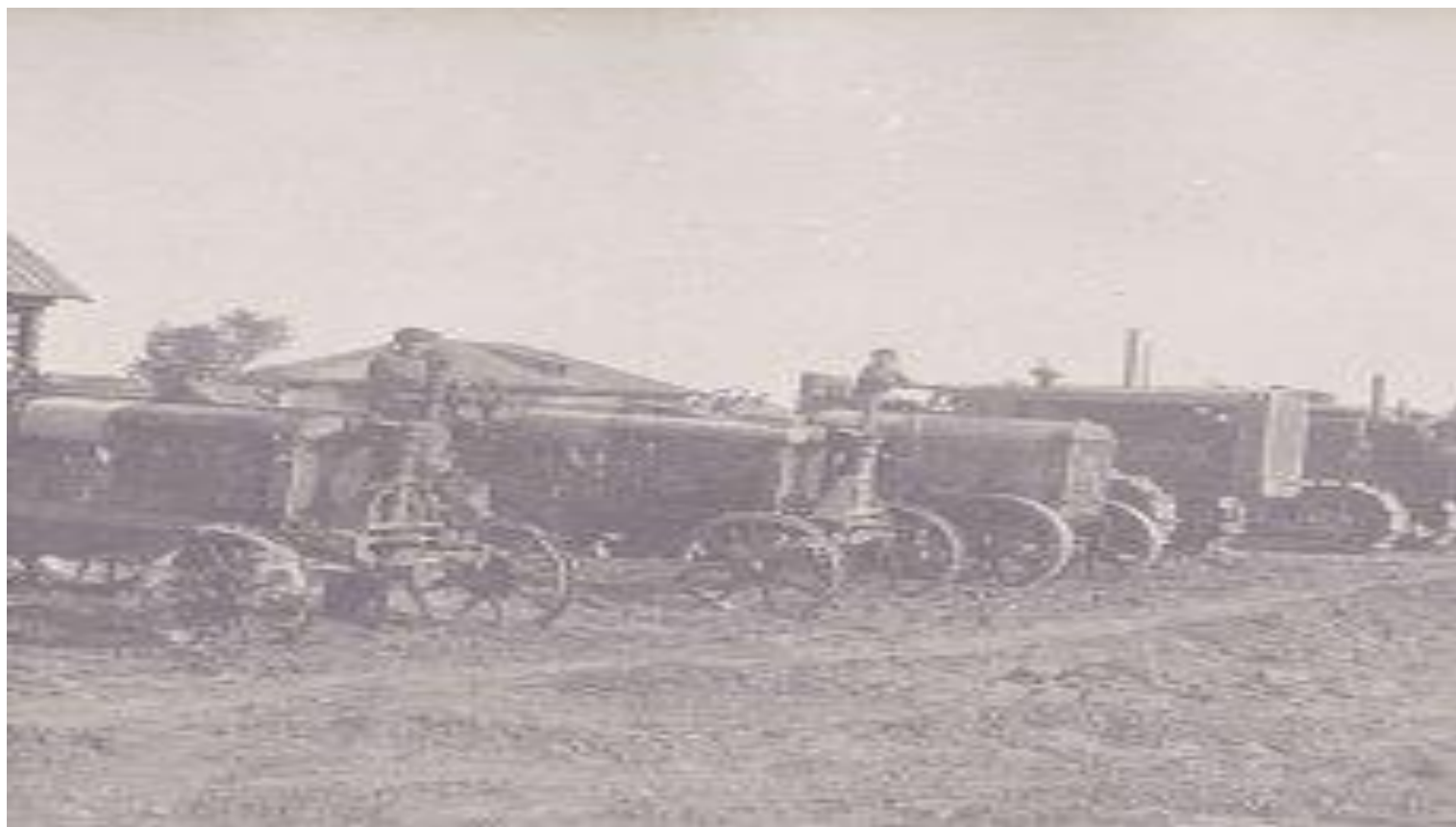
Начало создания отрасли сельскохозяйственного машиностроения

23 апреля 1924 года Совнарком принял «Декрет о снабжении сельского хозяйства орудиями производства и металлами». Возможность финансирования нового строительства и реконструкции существующих заводов в стране появилась в 1924 г. Это сразу отразилось на производстве техники для сельского хозяйства. В мае 1924 г. на Харьковском паровозостроительном заводе началось серийное производство первых советских гусеничных тракторов «Коммунар».