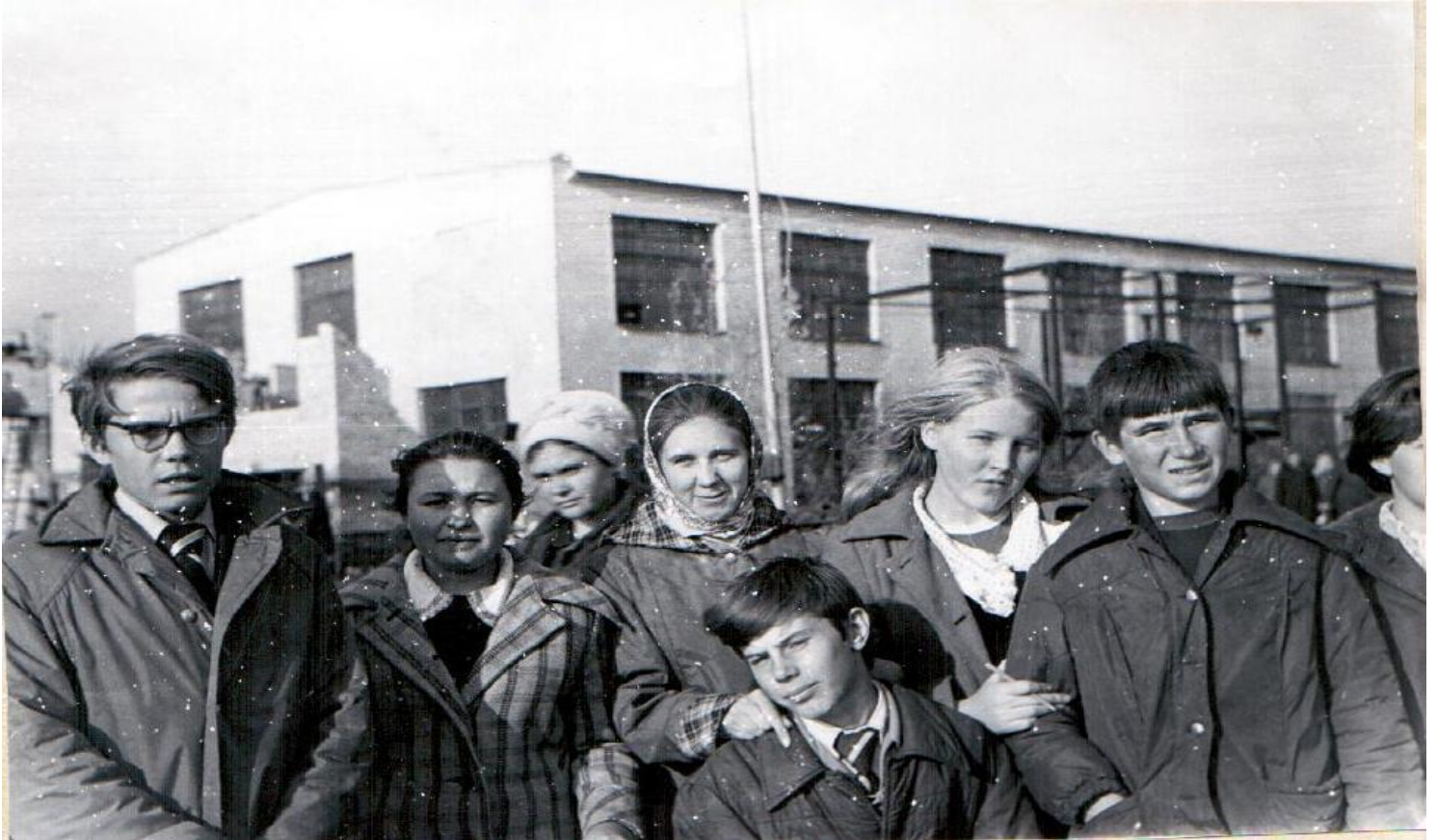
Учащиеся 8-го класса школы №1 на экскурсии на завод. Год 1977.

Завод занимался подготовкой молодежи рабочим специальностям. Практические занятия проводились с учащимися СПТУ-6, школ №2 и №5.