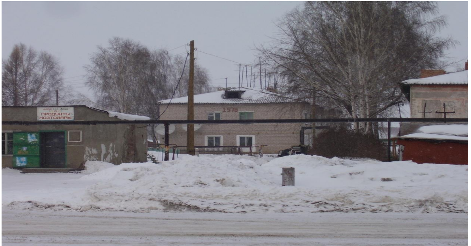
Ул. Залесовская. Дома для работников завода